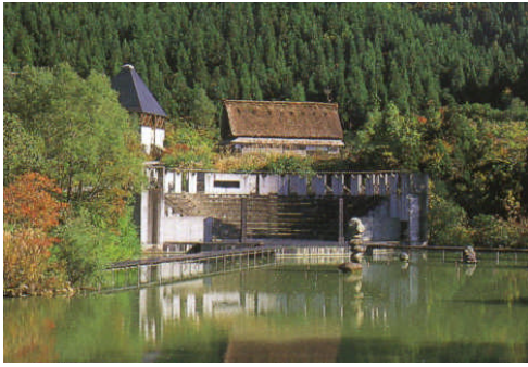
(1) 【土の賞】 富山県利賀芸術公園(南砺市)