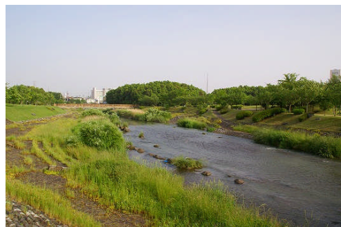
(5) 【緑の賞】 北日本新聞 創造の森 越中座(富山市)