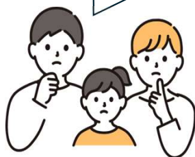
利用者 （医療的ケア児とその家族）