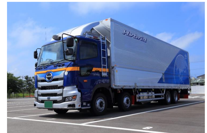
環境対応車（ハイブリッドトラック）