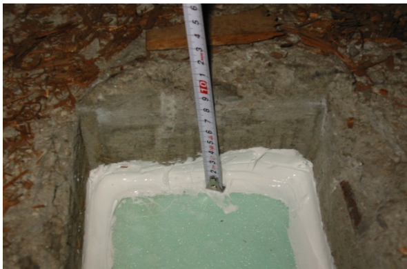
(底面スタイロ敷き・隙間をシーリング)