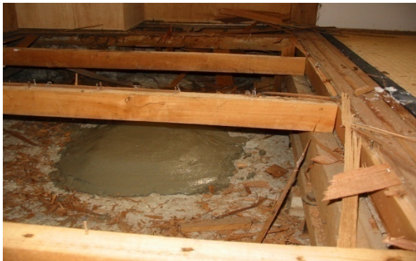
(無収縮モルタルにて充填)