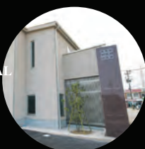
CHUO DENTAL CLINIC