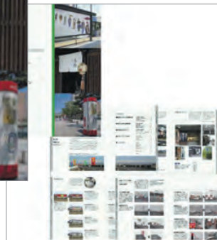
Design Guideline of Signs in Toyama