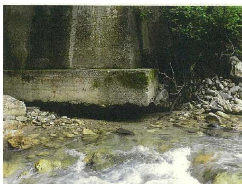
補修箇所（洗掘防止のため根継工を実施）