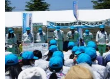
森・川・海の関係者が参加する森づくりフェアの開催

「県民参加の森づくりフェア」において、小中学生による森・川・海環境保全活動の紹介や交流活動など