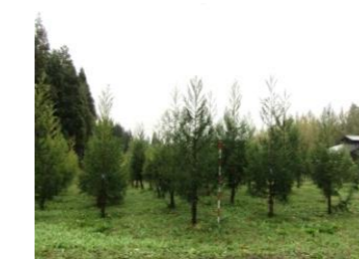
無花粉スギ展示選抜林 (H29イメージ)

・全国に先駆けて開発した優良無花粉スギ「立山 森の輝き」の県内外への普及推進 ・展示選抜林の整備による苗木の増産体制の確保 ・首都圏での植樹活動