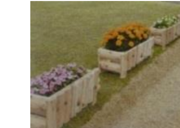
全国植樹祭会場での県産材プランター