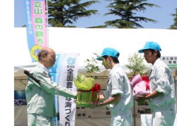
海づくり大会での苗木の育成依頼