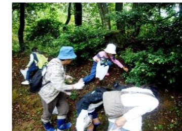
苗木の種子を森づくりボランティア等が採取

森づくりボランティアや花とみどりの少年団等の県民協働による、記念植樹用の苗木の育成