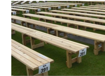
全国植樹祭会場での県産材ベンチ

多くの参加者が見込まれる大規模イベントで使用する、県産材ベンチ・プランターの開発・製作