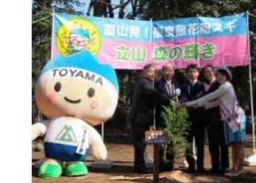
日比谷公園での記念植樹 (H25.2.21)