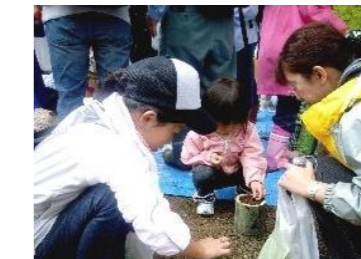
県産広葉樹苗を県民協働で育成