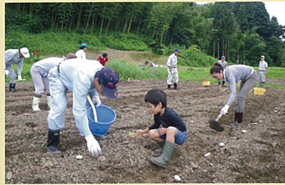
▲契約栽培・企業の福利厚生