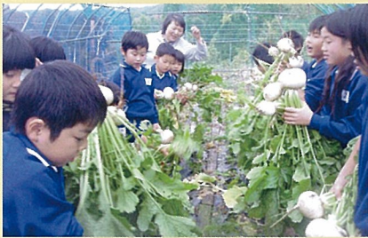
▲体験農園・学童農園