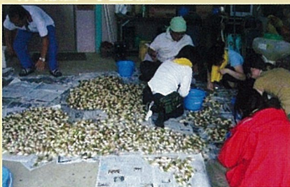
▲収穫ボランティア