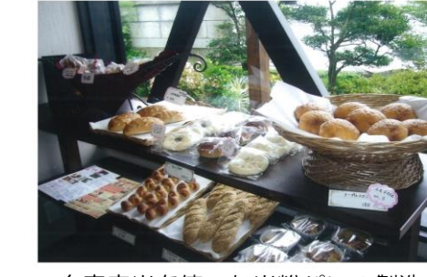
自家産米を使った米粉パンの製造