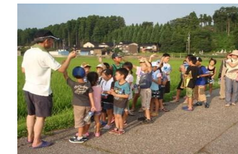
地域ぐるみの環境保全活動