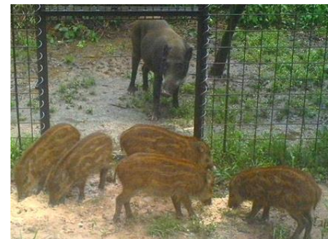
イノシシ捕獲檻の設置