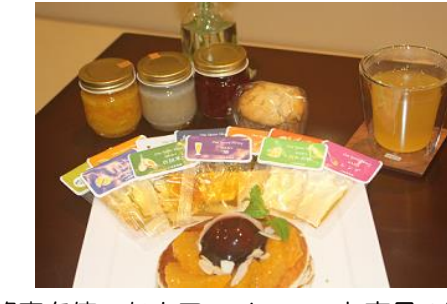
蜂蜜を使ったカフェメニューと商品の開発