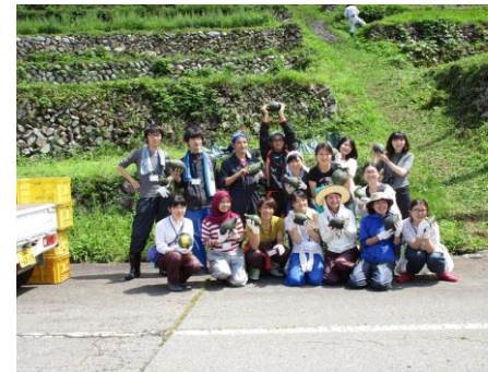
集落と地域内外の団体等との連携