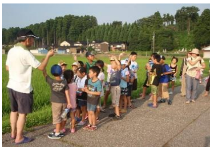
地域ぐるみの環境保全活動