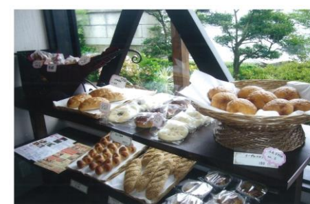
自家産米を使った米粉パンの製造

元気な中山間地域づくり支援事業（中山間地域等直接支払制度） 予算額：600,090千円（644,570千円） 条件不利地域における耕作放棄地の発生防止と多面的機能の維持増進への支援