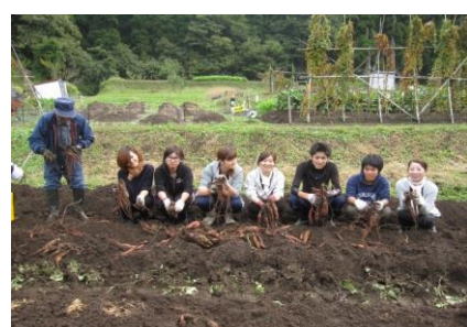
集落と地域内外の団体等との連携