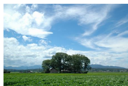
屋敷林のある散居村景観