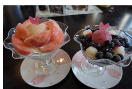
自家産果樹を使ったスイーツ加工