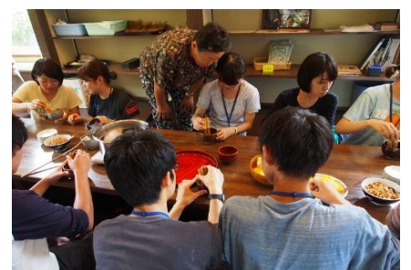
とやま農山漁村インターンシップ