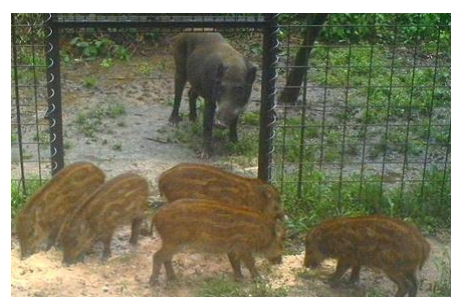
イノシシ捕獲檻の設置