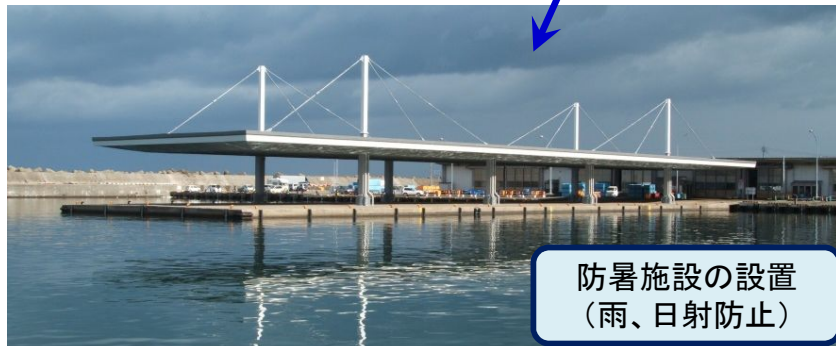
防暑施設の設置 (雨、日射防止)