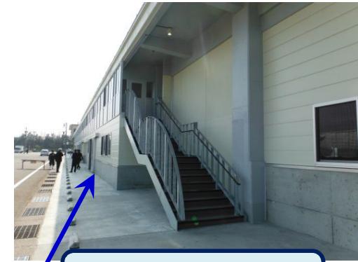
見学者通路の整備 (荷捌作業スペースとの分離)