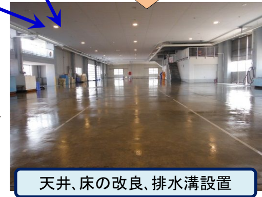
天井、床の改良、排水溝設置