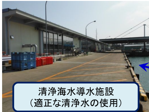
清浄海水導水施設 (適正な清浄水の使用)