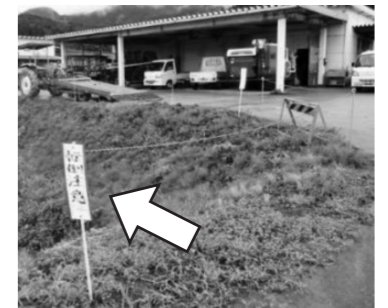
(例) 転落の危険性を警告する看板設置