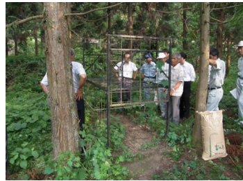
一箱わな設置研修状況

近年野生鳥獣による農作物等の被害が全国的に拡大しており、富山県内の平成21年度農作物被害額は1億4600万円となっています。