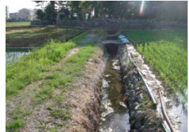
↑老朽化した既設水路