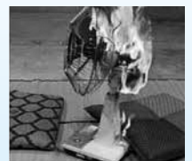
内部部品から発火