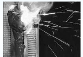
室内外ユニット間配線の途中接続により発火