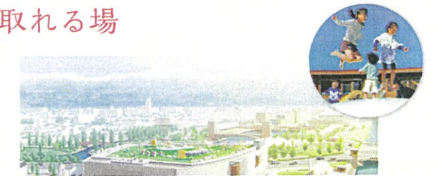
屋上庭園イメージ

環水公園や美しい立山連峰を望む屋上庭園には、グラフィックデザイナーの佐藤卓氏によるデザイン性の高い造形遊具を設置し、身体を動かしながらアートやデザインを体感できるこれまでにない空間となります。