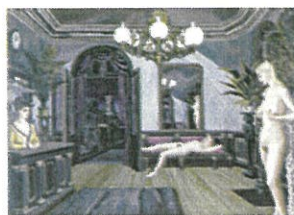
ポール・デルヴォー 「夜の汽車」 1947年 キャンバス・油絵具