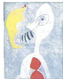
ジョアン・ミロ 「パイプを吸う男」 1925年 キャンバス・油絵具