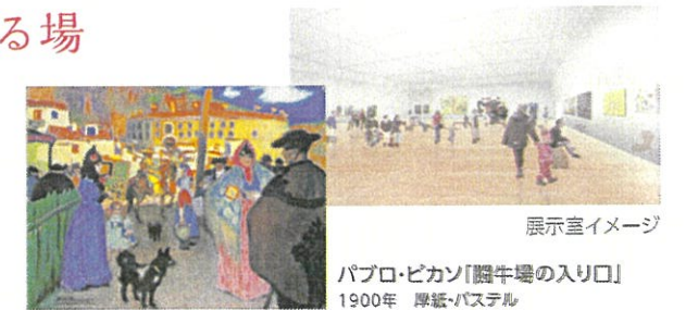
パブロ・ピカソ「闘牛場の入り口」 1900年 厚紙・パステル

日本有数の20世紀コレクションを新しいテーマや切り口で紹介。展示室を組み合わせる様々な規模の企画展を開催します。吹き抜け空間のホワイエでは、コンサートやトークショー、ファッションショーなど様々なイベントも開催します。