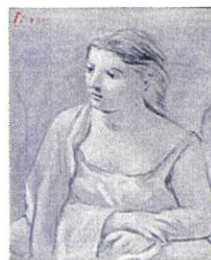
パブロ・ピカソ 「肘かけ椅子の女」 1923年 キャンバス・油絵具

気軽に美術館に訪れてもらい、20世紀美術を代表する名品を鑑賞したり、特色あるポスター、椅子などの展示を楽しみ学ぶことができます。