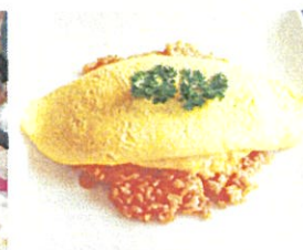
老舗洋食店「たいめいけん」の「タンポポオムライス」