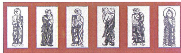
横方志功 「二菩薩釈迦十大弟子」(半双) 1939年 紙・木版