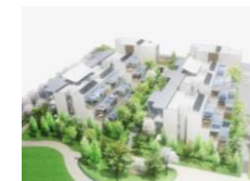
YKKバッドシップタウン 黒部モデル