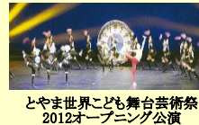
とやま世界こども舞台芸術祭 2012オープニング公演