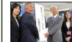
富山くらし・しごと支援センター