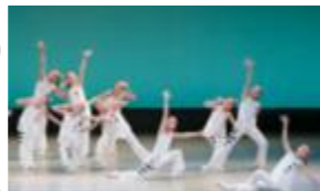
県民芸術文化祭2013 オープニングフェスティバル