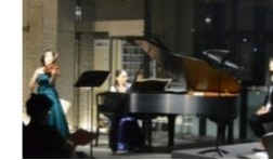
朗読と音楽の夕べ