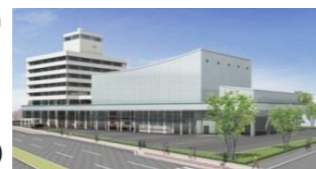
改修後の県民会館（イメージ）