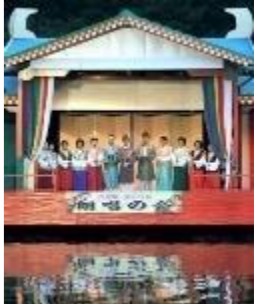
万葉集全20巻 朗唱の会