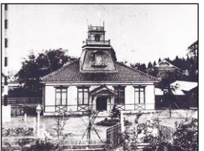
旧 伏木測候所の望楼の復原（高岡市）