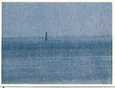
No.42 納沙布岬からわずか3.7kmに位置する貨島

研究において学んだことをできるだけたくさんの人に話してあげることだと思います。この北方領土問題は、北海道の人や元住民だけで解決するのは難しいです。今後は、日本全体で北方領土問題と向き合っていく必要があります。