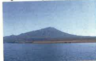
●コンプキルの風景 (国後島)

住民のほとんどがコニゲ漁を中心にして生活していました。仕事は朝早くから夜まで行われていたようです。最盛期はコニゲがとられ、全国に運ばれました。また、冬は海が雪と氷で一面が白くわかれ、コニゲ漁ができません。帰る冬は地元にくる人もいました。