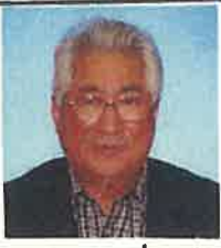
得能 宏 元 色丹島 出身

ベリアで収容された。収容所でのくらしは衛生面などから最悪だった。収容所では、飢えに苦しむ人が七くなっていた。本州に戻、てからもう七十年近くもたつ。七十年という年月が流れてもまだ墓参りにすら行けない。今、限られた回数しか行けないが、いつか自由に行けるようになることを願っていた。