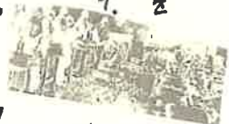
コニア漁を したりして 暮らしていた。