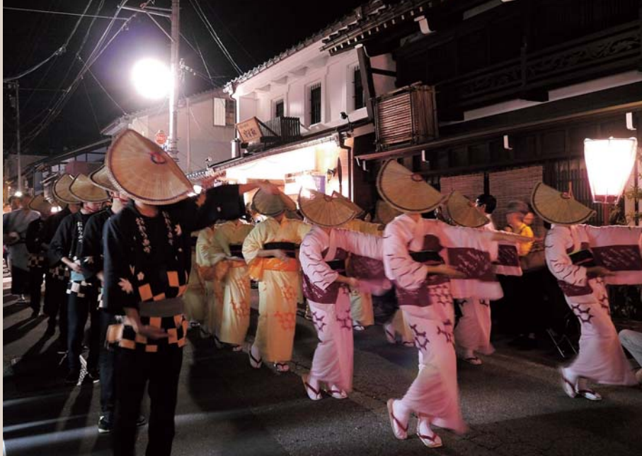
越中おわら風の盆