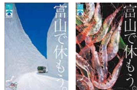
観光ポスター「富山で休もう。」

自然、食べ物、歴史・文化など富山県の魅力が広く知られ、国内外から多くの観光客がおとずれています。