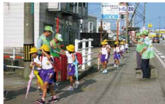
児童の見守り活動

鉄道、路面電車、バスなどが利用しやすく、お年寄りや障害のある方にもやさしいまちになっています。