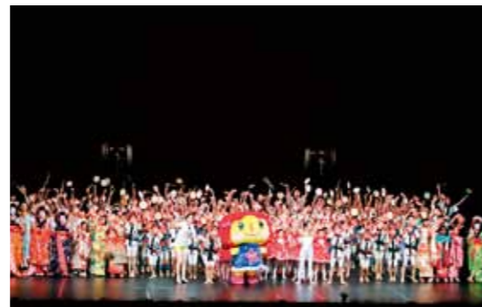
とやま世界こども舞台芸術祭2012