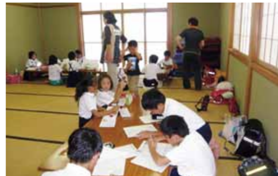
とやまっ子さんさん広場 (子どもの居場所づくり活動)

ふるさとに誇りと愛着を持ち、世界で活躍するチャレンジ精神を持った若者が育っています。