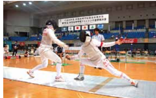
2012北信越かがやき総体

多くの人々が健康でスポーツに親しんでいて、一人ひとりに運動する習慣がしっかりと根付いています。