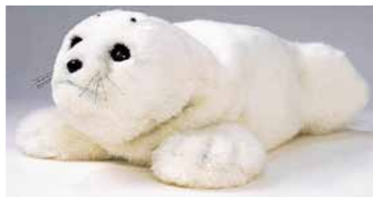
心がなごむロボット「パロ」

富山県産のおしくて安全な農作物や肉、魚などを、多くの県民がたくさん食べています。