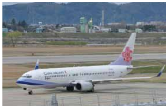
富山空港(富山-台北便)

港や道路が整備されていて、富山県が、日本海を取りまく地域やアジア地域で、物の流れの中心となっています。