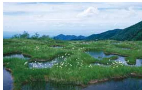
ラムサール条約湿地に登録された立山弥陀ヶ原

廃棄物の発生抑制や再利用など、エコライフの実践が進み、小水力発電(※)など、再生可能エネルギーが活用されています。