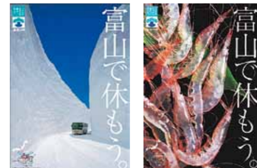
観光ポスター「富山で休もう。」

自然、食べ物、歴史・文化など富山県の魅力が広く知られ、国内外から多くの観光客が訪れています。