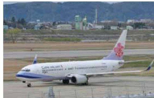
富山空港(富山-台北便)

港や道路網が整備されていて、富山県が、環日本海地域の物流、経済交流、海外ビジネス展開の拠点となっています。