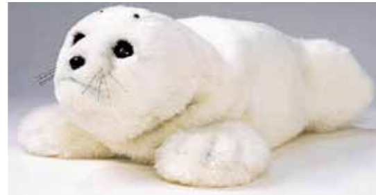
癒しロボット「パロ」

幅広い世代の人が農林水産業に従事し、富山県産の良質で安全な農作物や肉、魚などを、多くの県民がたくさん食べています。