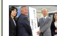
富山くらししごと支援センター