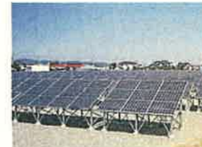
メガソーラー (富山市)