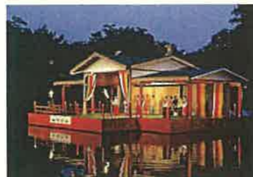
越中万葉朗唱の会（高岡市）