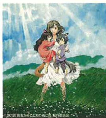
富山地域をイメージした映画による魅力発信(映画「おおかみこどもの雨と雪」より)