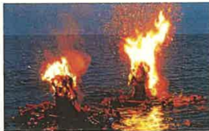
ネブタ流し (滑川市)

地域資源の活用や都市住民との交流、豊かで多様な「とやまの森」の整備・保全などを通じて、個性豊かな魅力ある農山漁村づくりを進めます。