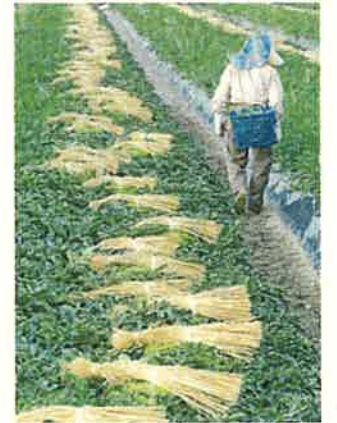
ジャンボ西瓜(入善町)

黒部峡谷、宇奈月温泉等の魅力ある観光資源を活用し、滞在・体験型観光の推進を図るとともに、富山湾・黒部峡谷・越中にかわ観光圏等とも連携しながら、選ばれ続ける観光地づくりを進めます。