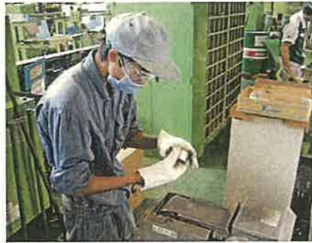
高校生インターンシップ（魚津市）

自然、歴史・伝統文化など、富山らしい地域の魅力の継承、再発見と地域の魅力発信による交流人口の拡大、定住・半定住の促進に努めます。