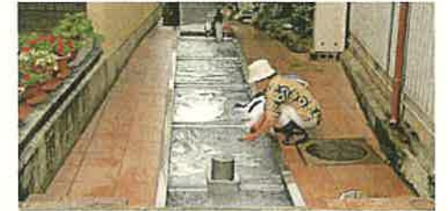
共同洗い場（黒部市）