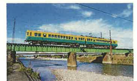
映画「RAILWAYS 愛を伝えられない大人たちへ」の舞台となった、富山地方鉄道(魚津市片貝川橋梁付近)