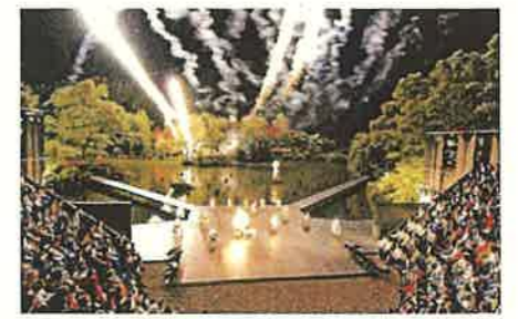
利賀芸術公園での舞台公演 「世界の果てからこんにちは」(南砺市)