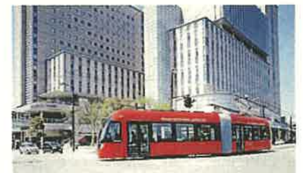
万葉線アイトラム（高岡市・射水市）