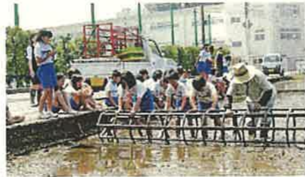
田植え体験 (舟橋村)

自然、歴史・伝統文化など、富山らしい地域の魅力の継承、再発見と地域の魅力発信による交流人口の拡大、定住・半定住の促進に努めます。