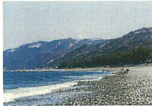
ヒスイ海岸（朝日町）

地域資源の活用や都市住民との交流、豊かで多様な「とやまの森」の整備・保全などを通じて、個性豊かな魅力ある農山漁村づくりを進めます。