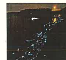
ホタルイカ群遊(滑川市)

広域的な交通基盤である北陸新幹線、伏木富山港(富山地区)等の整備促進や富山空港の機能充実、交通アクセスの向上等により、賑わいの創出、地域の活性化を図ります。