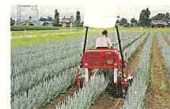
ねぎ土寄せ(立山町)

立山黒部アルペンルートなど、恵まれた自然景観や歴史・文化等の観光資源を活用し、滞在・体験型観光の推進を図るとともに、立山黒部アルペンルート広域観光圏等とも連携しながら、選ばれ続ける観光地づくりを進めます。