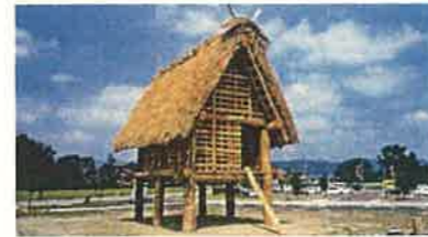
縄文の桜町遺跡（小矢部市）

地域資源の活用や都市住民との交流、豊かで多様な「とやまの森」の整備・保全などを通じて、個性豊かな魅力ある農山村づくりを進めます。