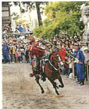
やんさんま（射水市）

地域資源の活用や都市住民との交流、豊かで多様な「とやまの森」の整備・保全などを通じて、個性豊かな魅力ある農山漁村づくりを進めます。