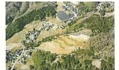
地すべり対策（氷見市）