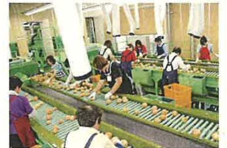
たまねぎ選果(砺波市)

五箇山の合掌造り集落などの歴史的資産、全国的なイベントを活用し、滞在・体験型観光の推進を図るとともに、越中・飛騨観光圏等とも連携しながら、選ばれ続ける観光地づくりを進めます。