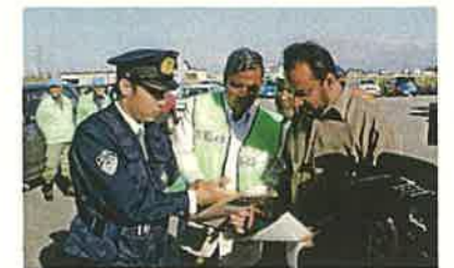
地域住民と協力して取り組む防犯パトロール（射水市）