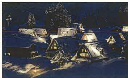
五箇山合掌造り集落(南砺市)