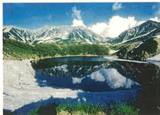
室堂みくりが池(立山町)