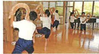
地域の伝統文化を学ぶ（南砺市）

自然、歴史・伝統文化など、富山らしい地域の魅力の継承、再発見と地域の魅力発信による交流人口の拡大、定住・半定住の促進に努めます。