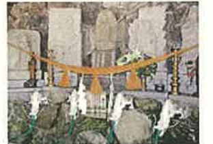
穴の谷の霊水 (上市町)

自然環境に配慮しつつ、治山・治水・海岸保全等の施設整備を着実に進めるとともに、防災・防犯対策の充実による安全・安心なまちづくりを進めます。