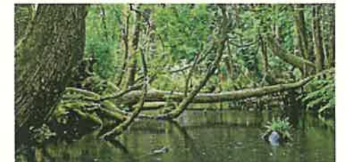
杉沢の沢スギ（入善町）

自然環境に配慮しつつ、治山・治水・海岸保全等の施設整備を着実に進めるとともに、防災・防犯対策の充実による安全・安心なまちづくりを進めます。