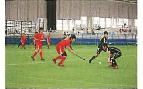
地域に根づくスポーツ（小矢部市）

五箇山県立自然公園や白山国立公園などの豊かな自然環境を保全するとともに、地域特性を活用した再生可能エネルギーの導入を促進します。また、豊かな水資源の保全と有効活用に努めます。