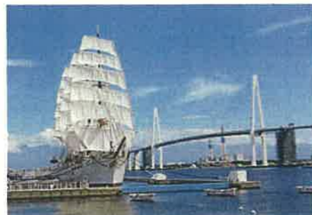
新湊大橋と海王丸（射水市）