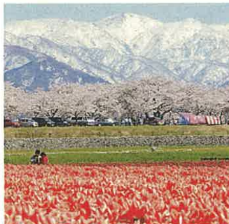
朝日岳・白馬岳(朝日町)