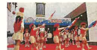
とやまっ子まちなかアート(富山市)