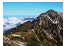
剱岳（上市町、立山町）