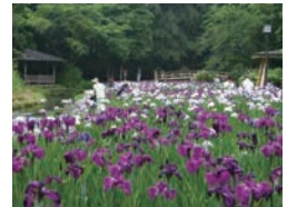
行田の沢清水（滑川市）

自然環境に配慮しながら、治山・治水・砂防・海岸保全等の施設整備を着実に進めるとともに、防災・防犯対策の充実等により安全・安心なまちづくりを進めます。