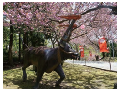
倶利伽羅県定公園（小矢部市）

自然環境に配慮しながら、治山・治水・砂防等の施設整備を着実に進めるとともに、防災・防犯対策の充実等により安全・安心なまちづくりを進めます。