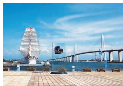
新湊大橋と海王丸(射水市)