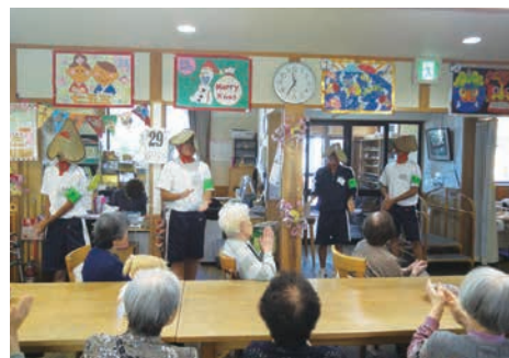
「社会に学ぶ14歳の挑戦」 介護施設での職場体験（富山市）

若者がたくましく成長するとともに、職業的・社会的に自立し、地域社会に積極的に関わろうとする態度を身につけることができるよう支援します。