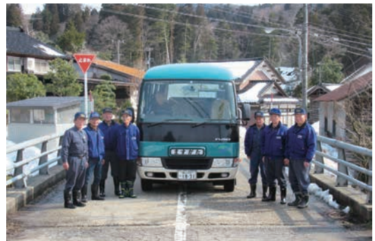
八代地域活性化協議会（氷見市）