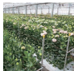
次世代施設園芸品目 （トルコギキョウ（富山市））