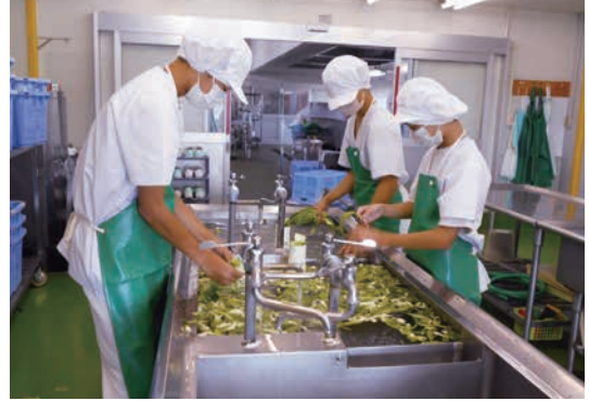
【社会に学ぶ14歳の挑戦】 共同調理場での職場体験（高岡市）

若者がたくましく成長するとともに、職業的・社会的に自立し、地域社会に積極的に関わろうとする態度を身につけることができるよう支援します。