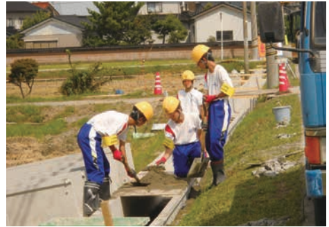
「社会に学ぶ14歳の挑戦」 建設現場での職場体験（黒部市）

若者がたくましく成長するとともに、職業的・社会的に自立し、地域社会に積極的に関わろうとする態度を身につけることができるよう支援します。