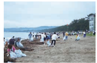
海岸での清掃美化活動（氷見市）

自然環境に配慮しながら、治山・治水・砂防・海岸保全等の施設整備を着実に進めるとともに、防災・防犯対策の充実等により安全・安心なまちづくりを進めます。