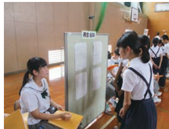
小中一貫教育（舟橋村）

地域の文化施設の活用や地域に根差したスポーツへの支援を通して、文化やスポーツに親しむことのできる環境づくりを進めるとともに、地域における多彩な県民活動を推進します。