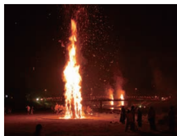
におとんぼ焼き（上市町）