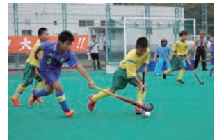
地域に根差したスポーツ （ホッケー〈小矢部市〉）

魅力あるまちの景観や伝統文化など、地域の魅力を再発見し、発信することにより、個性豊かな魅力ある地域づくり・農山村づくりを進め、交流人口の拡大や、移住者の増加を図ります。