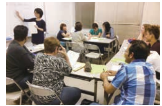
外国人住民向け初期日本語教室の授業風景（射水市）

魅力あるまちの景観や伝統文化など、地域の魅力を再発見し、発信することにより、個性豊かな魅力ある地域づくり・農山漁村づくりを進め、交流人口の拡大や、移住者の増加を図ります。