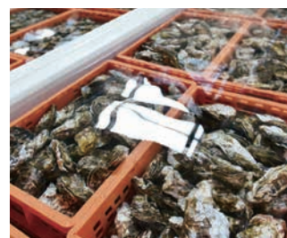
深層水仕込カキ(入善町)