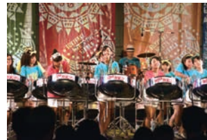
スキヤキ・ミーツ・ザ・ワールド （南砺市）