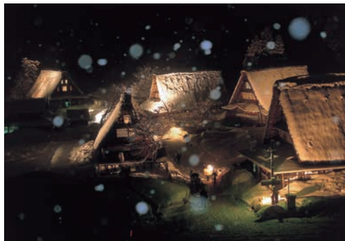
五箇山合掌造り集落(南砺市)