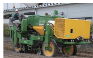
チューリップ球根ネット栽培用ロボット（砺波市）

東海北陸自動車道など広域的な交通基盤の整備促進や、交通アクセスの向上により、地域の活性化を図ります。