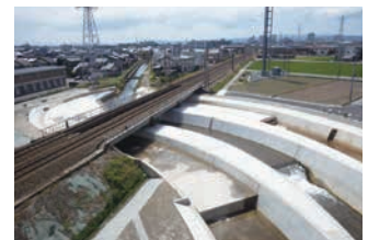
河川改修（地久子川〔高岡市〕）