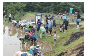
棚田オーナーによる田植え作業（氷見市）