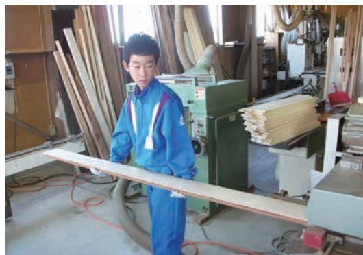
「社会に学ぶ14歳の挑戦」 建具工場での職場体験（砺波市）

若者がたくましく成長するとともに、職業的・社会的に自立し、地域社会に積極的に関わろうとする態度を身につけることができるよう支援します。