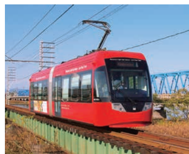
万葉線(高岡市、射水市)

富山湾などの恵まれた自然景観や歴史・伝統文化等の観光資源を磨き上げ、滞在・体験型観光の推進を図るとともに、地域のブランド力アップを目指します。