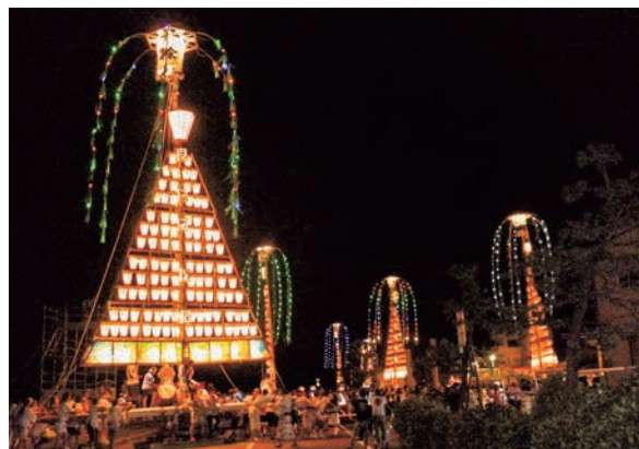
魚津のタテモン行事 (魚津市)