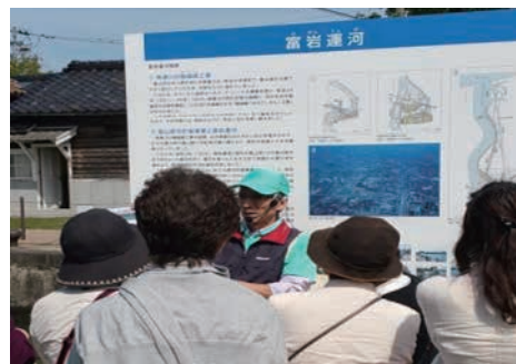
富岩運河かたりべの会による 観光ガイド（富山市）