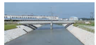
河川改修（黒瀬川〈黒部市〉）