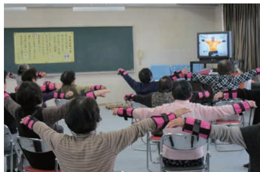
はつらつ塾（砺波市）