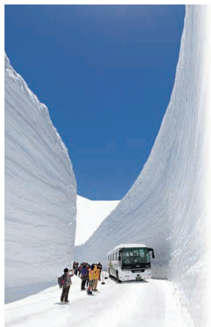
立山黒部アルペンルート(立山町)