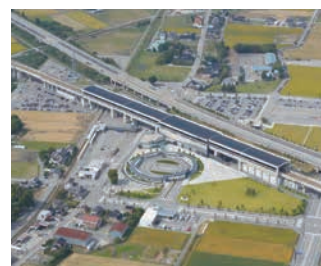
黒部宇奈月温泉駅(黒部市)

黒部峡谷、宇奈月温泉等の地域の観光資源の磨き上げ、滞在・体験型観光の充実を図るとともに、周囲の観光圏と連携しながら地域の魅力を発信し、選ばれ続ける観光地づくりを進めます。