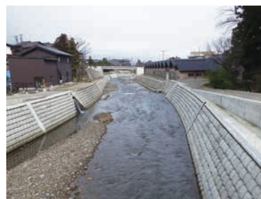
砂防関係施設の整備 （小矢部川水系池川〈南砺市〉）