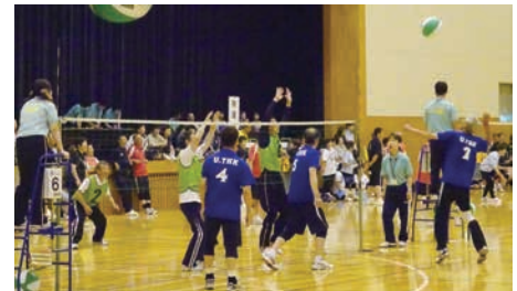
地域に根差したスポーツ（ビーチボール〈朝日町〉）

魅力あるまちの景観や伝統文化など、地域の魅力を再発見し、発信することにより、個性豊かな魅力ある地域づくり・農山漁村づくりを進め、交流人口の拡大や、移住者の増加を図ります。