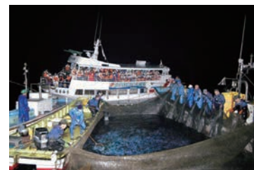
ホタルイカ観光（滑川市）