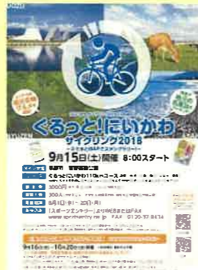
ぐるっと!にいかわサイクリング2018チラシ