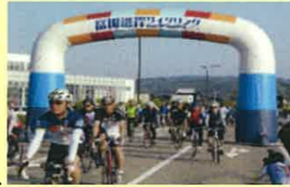
富山湾岸サイクリング