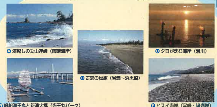
④ 海越しの立山連峰 (雨晴海岸) ⑤ 夕日が沈む海岸 (湊川) ⑥ 古志の松原 (岩瀬～浜黒崎) ⑦ 水見市漁業文化交流センター