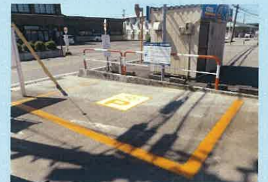
赤田バス停駐輪場(富山市) (平成29年度県補助事業)