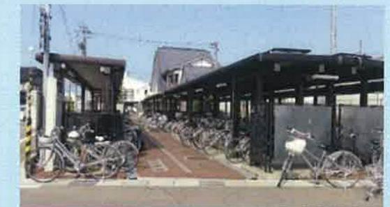
あいの風とやま鉄道福岡駅周辺駐輪場整備(高岡市) (平成25年度都市再生整備計画事業)