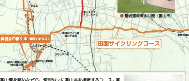
⑱ カフェ海辺の生活 ⑲ パノラマレストラン 光彩 ⑳ 舟橋村 ㉑ 富山県総合体育センター (富山さときと空港隣接) ㉒ 富山県美術館 (富山市) ㉓ 富山県美術館 (富山市)