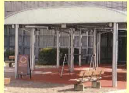
サイクルステーション (富山きときと空港と総合体育センターの連絡通路内)