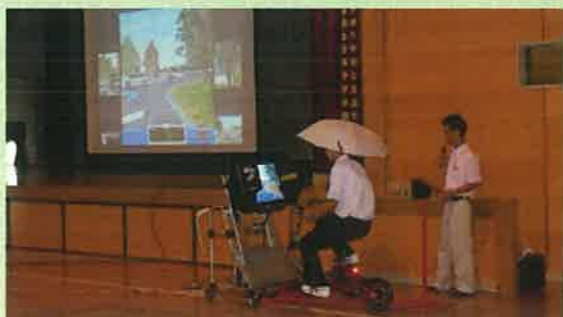
自転車シミュレータを使用した交通安全教室