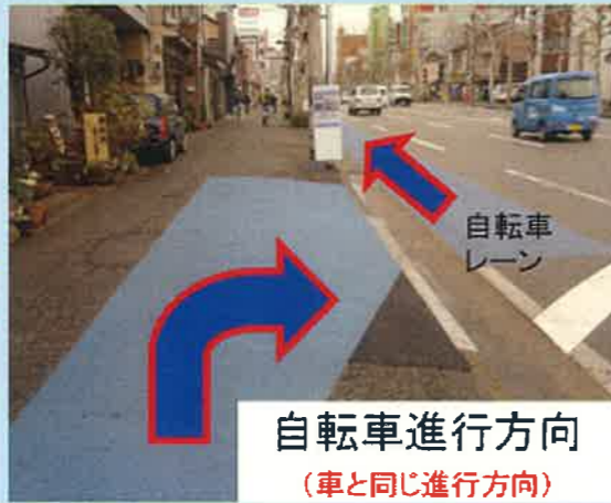
自転車レーン