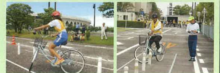
交通安全子供自転車大会