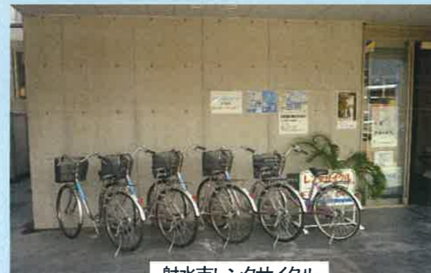
射水市レンタサイクル