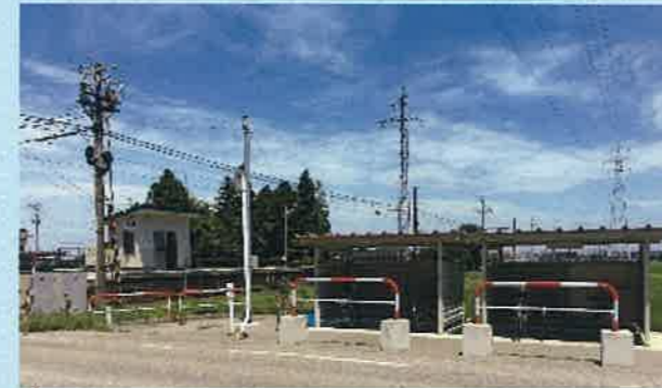
富山地鉄田添駅駐輪場(立山町) (平成27年度県補助事業)

市町村又は交通事業者等が実施するパークアンドライド（自転車含む）のための駐車場の整備事業又はパークアンドライドの普及啓発事業に対し、県補助金を交付