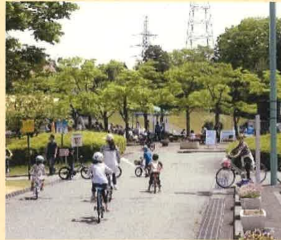
太閤山ランドにおけるレンタサイクル

県民公園太閤山ランド、クロスランドおやべ、いこいの村磯波風等において、シティサイクルやマウンテンバイク、電動アシスト自転車やタンデム自転車、変わり種自転車(おもしろ自転車)などのレンタルを実施