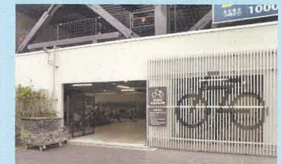
中心市街地駐輪場整備(富山市) (平成28年度都市再生整備計画事業)

県内自治体では、交通結節点の機能強化やまちなかの回遊性を目的に、駅周辺や中心市街地に駐輪場の整備を実施 (都市再生整備計画事業)