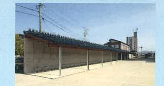
JR氷見線氷見駅周辺駐輪場整備(氷見市) (平成27年度都市再生整備計画事業)