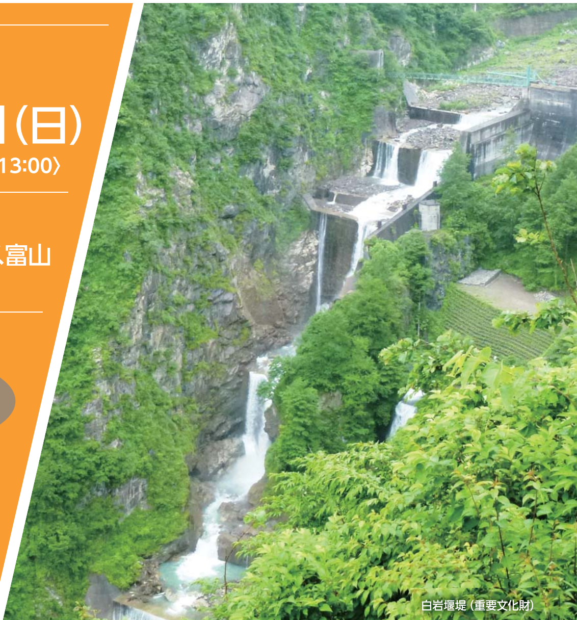
白岩堰堤 (重要文化財)