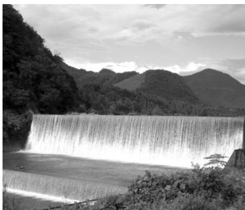
本宮堰堤 (重要文化財)

このシンポジウムでは、世界遺産の最前線で活躍する専門家に、世界遺産における20世紀遺産の意義や立山砂防が日本の20世紀遺産20選に選定された意義について講演・パネルディスカッションしていただき、立山砂防のその顕著な普遍的価値を広く世界に発信します。