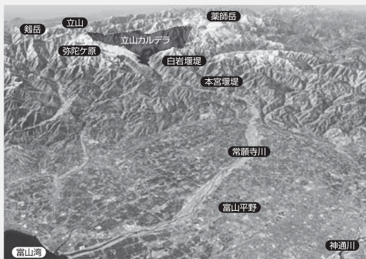
国土地理院の基盤地図情報標高10mメッシュを使用