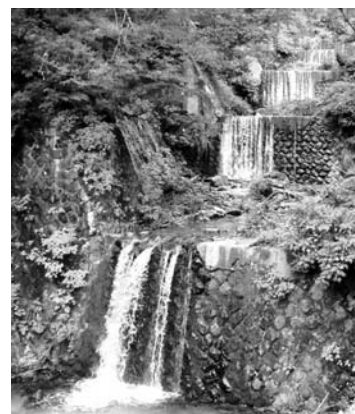
泥谷堰堤 (重要文化財)