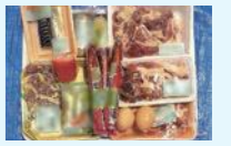
県内で捨てられた手付かず食品

「とやま食ロスゼロ作戦」の着実な実行による食品ロス等を削減する県民運動の展開、食品ロス削減のための商慣習見直しの推進等