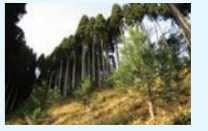
伐採跡地に植栽された優良無花粉スギ「立山 森の輝き」

スギ伐採跡地への優良無花粉スギ「立山 森の輝き」の植栽推進など県民参加の森づくりの推進