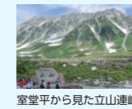
室堂平から見た立山連峰