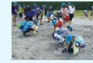
国際海洋環境保全活動