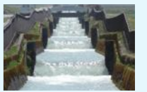
落差を有する農業用水路