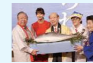
「富山のさかな」おもてなしフェア