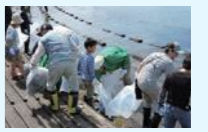
海岸清掃美化活動

漂着物の削減に向けた上流から下流まで県民総ぐるみで取り組む河川等の清掃活動の実施等