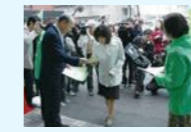
店頭でのマイバッグ持参呼びかけ

レジ袋の削減を目指してコンビニで使用する小型マイバッグの配布やマイバッグ使用等を呼びかける普及啓発、レジ袋無料配布廃止、「とやまエコストア制度」の普及拡大等