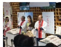
首都圏での「富富富」の先行販売会 (R1.10.3 日本橋とやま館)