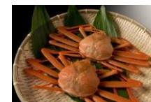
高志の紅(アカ)ガニ