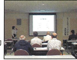
ホットスポット 実践講習