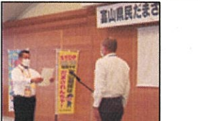
だまされんちゃ官民合同会議