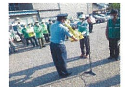
カギかけパトロール出発式