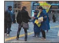
学生ボランティアの活動