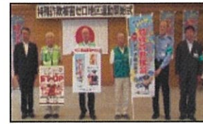
ゼロ地区運動開始式