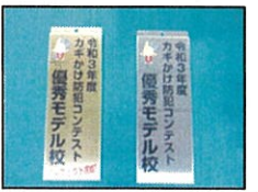
優秀モデル校記念品