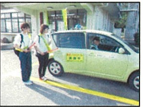
防犯ボランティア活動