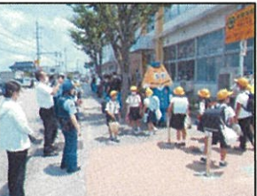
登下校の見守り活動