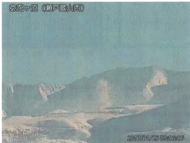
図 1 弥陀ヶ原 地獄谷からの噴気の状況 （1 月 26 日、瀬戸蔵山西監視カメラによる）

弥陀ヶ原近傍を震源とする火山性地震の発生回数は少なく、地震活動は低調に経過しています。火山性微動は観測されていません。