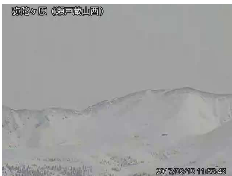
図 1 弥陀ヶ原 地獄谷からの噴気の状況 （2月18日、瀬戸蔵山西監視カメラによる）

弥陀ヶ原近傍を震源とする火山性地震の発生回数は少なく、地震活動は低調に経過しています。火山性微動は観測されていません。