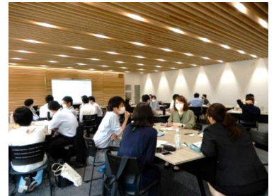
グループワーク風景