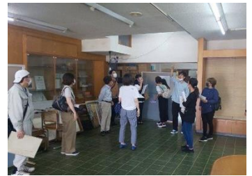
空き物件見学ツアー