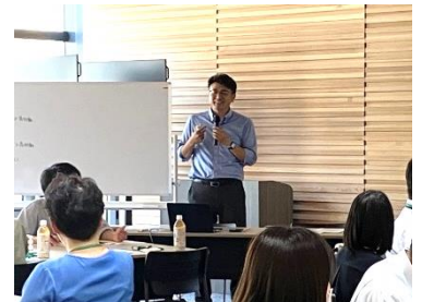
オープニングのひとコマ

後半は「行動型、感覚型、協調型、思考型」の4タイプのうち、自身がどれに当てはまるかを調べる「ソーシャルスタイル診断」を行いました。タイプによってコミュニケーションスタイルは違います。よりよいコミュニケーションを考えるよい機会となりました。ちなみに行政職員は、協調型、思考型が多い傾向があるとか。