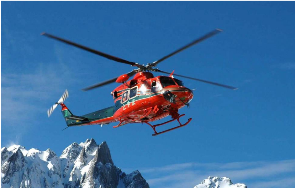
JA6768 Bell 412EP 平成8年4月~令和2年3月