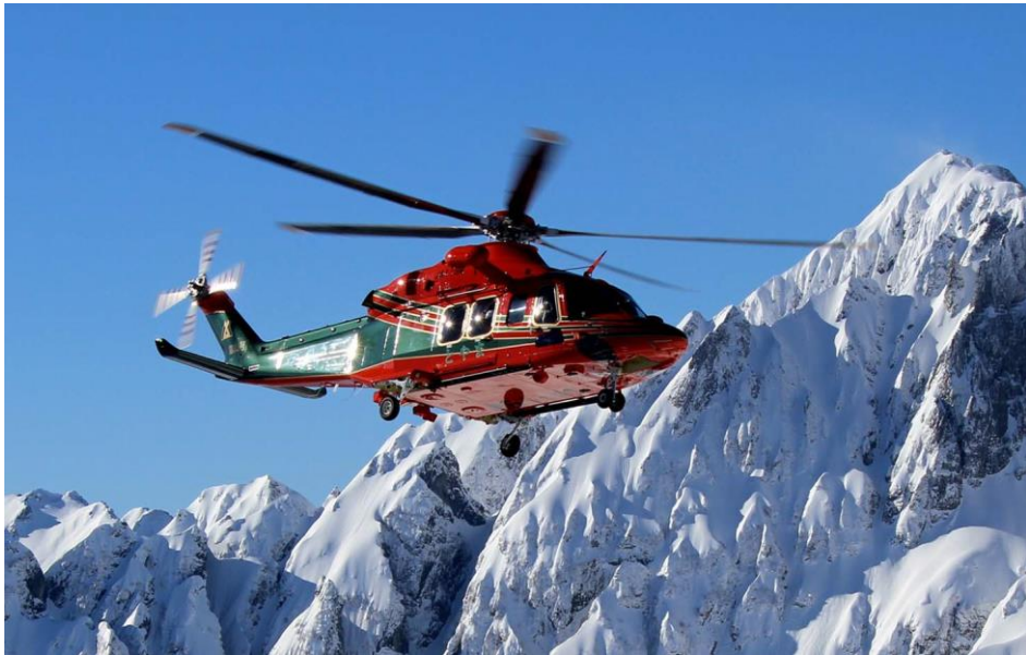
JA119W AW139 令和2年4月~