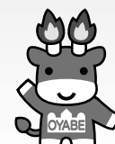
メルギューくん 小矢部市