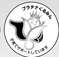
プラチナくるみん