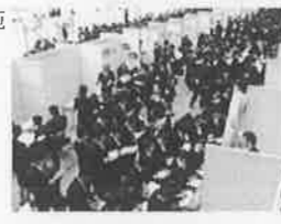
(Uターンフェアインとやまの様子)