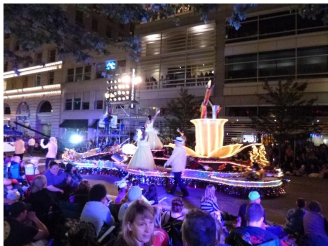
スターライト・パレード