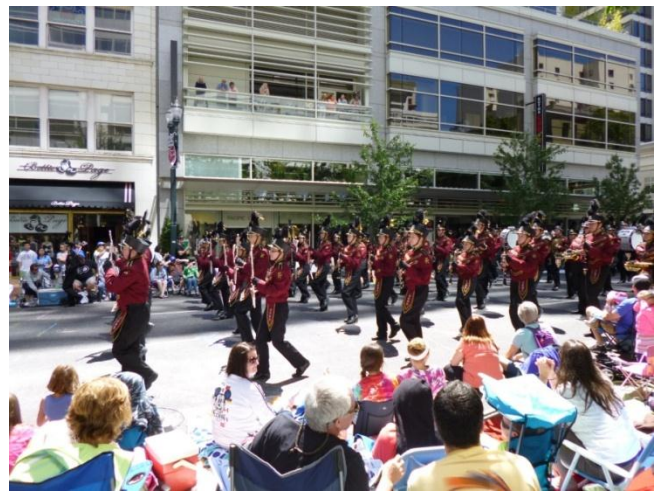
高校生のマーチングバンド