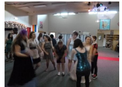
Awards Night 後のダンス