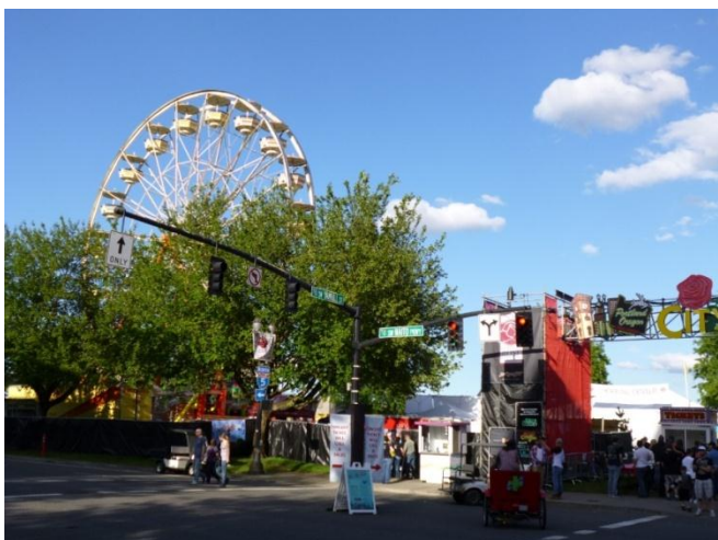
City Fair の入り口

5月の下旬から6月の中旬にかけて、オレゴン州最大の都市ポートランドでは、「ローズフェスティバル」が毎年開催されています。1907年に始まった歴史あるフェスティバルだそうです。期間中、ウィラメット川沿いの公園には、入場料7ドルで入れる仮設のイベント会場 City Fair が設置されています。中には、ライブなどを行うステージや食べ物を売るフードコート、移動遊園地があるそうです。また、軍艦の中を自由に見学できたり、ドラゴンボートレースが行われたりしています。中でも最大のイベントは、スターライト・パレードとグランド・フローラル・パレードです。企業や団体のほかにも、ポートランド近郊の高校のマーチングバンドもたくさん出場していました。昼間に行われるグランド・フローラル・パレードでは、たくさんの生花で飾られたフロート（山車）も次々に通り過ぎていき、とても華やかでした。沿道は、何時間も前から場所取りをして楽しみに待っていた人たちであふれ、大変賑わっていました。