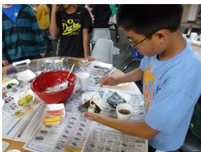
七夕手巻き寿司パーティー