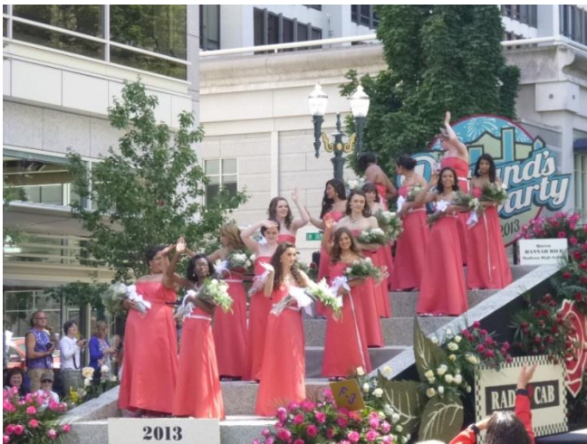
ポートランド地域の高校3年生から選出されるローズプリンセス