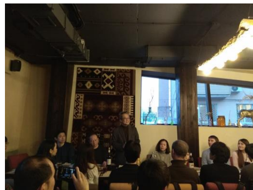
(写真4：マラソン大会打ち上げ)