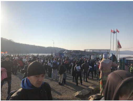
(写真3：マラソンスタート地点)

マラソン後には打ち上げを兼ねた日本人会の集まりがあり、日本からアイスマラソンに参加するためにウラジオストクに来られた日本人の方たちともお話することができました。