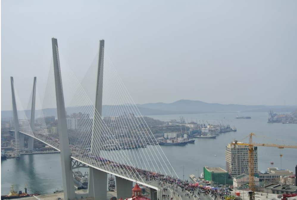
(写真1) 市中心部とルースキー島を結ぶ黄金橋。旧メーデーのため交通規制がかかり行進が行われた。

ただ、2012年9月にアジア太平洋経済協力（APEC）首脳会議が開催されたため、以前に比べて市内中心部の道路はかなり整備されたそうです。