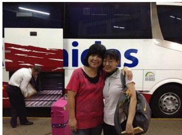
アリアンサの私の姉と…