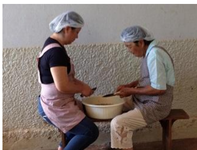
ささがきごぼうは炊き込みご飯に…