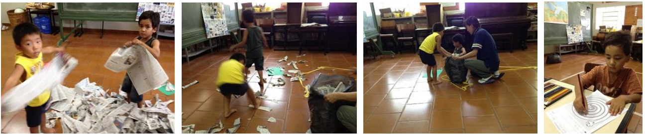
新聞紙活動 音楽に合わせて 破ります・踊ります・片づけます…

日本語学校は新しい仲間が増えて生徒数は10人になりました。みんなとても元気です。低学年クラスでは歌を歌ったり、新聞紙でゲームをしたり、ちぎり絵などをしながら、数や色の勉強をしました。中高学年クラスでは料理に関する言葉や表現、高学年クラスは漢字も沢山勉強しました。調理実習やステンシル、巾着作りなどもしました。