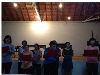
練習していた時を思い出し…