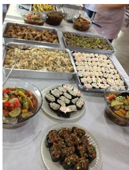
沢山の料理が並びました