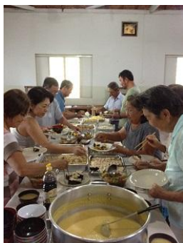
胡桃寿司・軍艦巻き・ナスニンニク醤油・きんぴら・鶏煮…