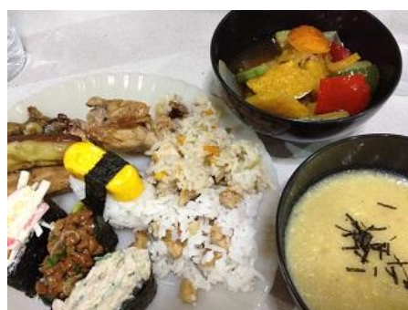
どれもとても美味しかったです