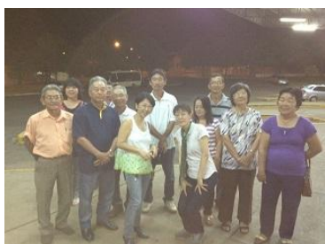
バスターミナルで