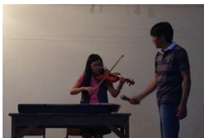
バイオリン演奏、素敵でした