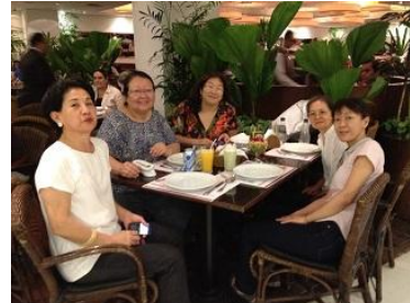
SP県人会の皆さんと昼食をご一緒しました