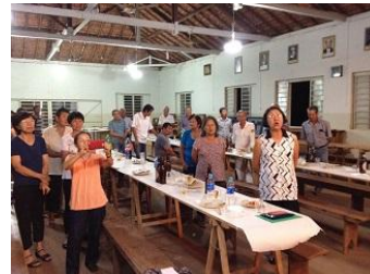
最後は「北国の春」を合唱