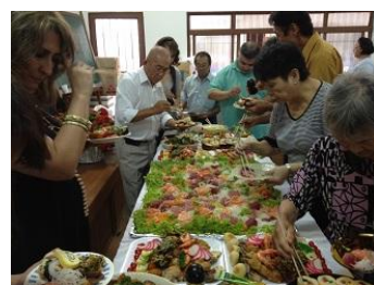
総会後のアルモツサ