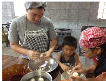
中高学年クラス 調理実習