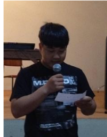
まさおくんの話は 印象的でした