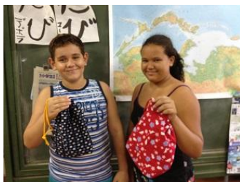
中学年クラス 巾着完成