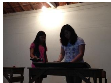
上手でとても独学とは思えません