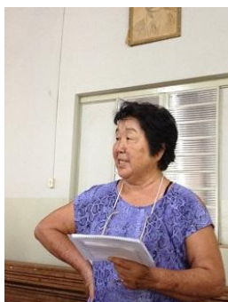
池田婦人会長より一言…