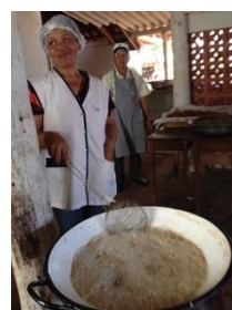
非日系のお母さま方も参加