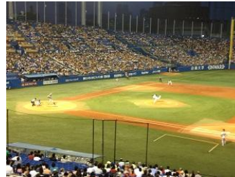
ナイター観戦ヤクルト巨人戦