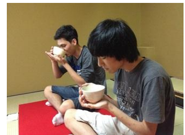
“お茶が熱い！” “全部飲みます？”