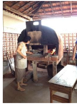
焼場担当数十年の大ベテランのお二人