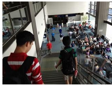
帰国 “また日本に来たい”