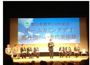
ホームカミングデー式典参加