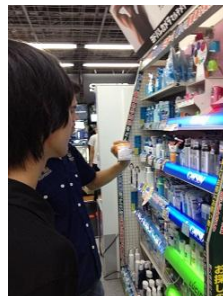
秋葉原でお土産を