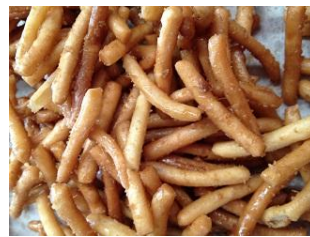
やめられないとまらないかりんとう