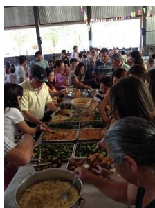
次々と料理が運ばれアルモツサ開始！ チケット売り場