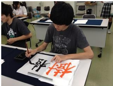
書道体験“みんな上手だった”