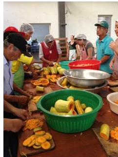
天ぷら仕込みはお父さんも手伝い…3000個揚げます