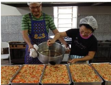
美味中華風白菜サラダ