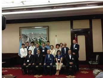
南米からの訪問団 (石井知事と記念撮影)