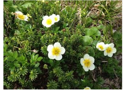
今年は雪が多く4月にも雪が降ったため、雪と花と一緒に見る事ができました。