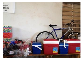
豪華景品は誰の手に？