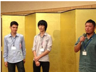
懐かしの大木先生・川口先生と…