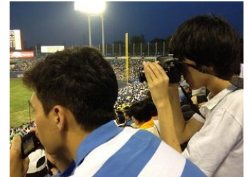
日系ブラジル人選手の活躍に注目