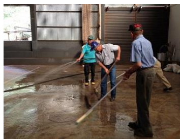
お父さんたちは会場設営担当