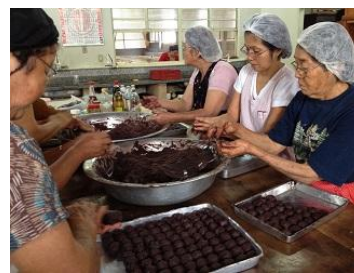
お饅頭1800個作ります