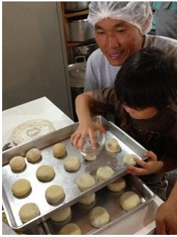
日本語学校の生徒も手伝います