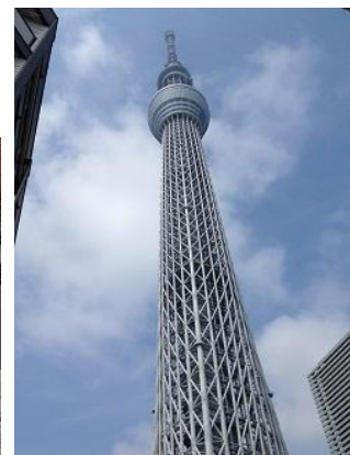
東京スカイツリー！（634m）