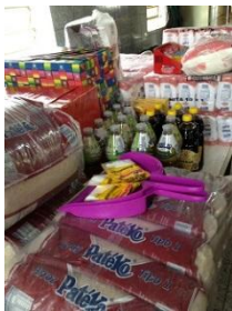
ずらりと並ぶ材料の数々…

今年は1000人以上のお客さんを見込んでの準備となり前日から大忙しでした。この日ばかりは家の仕事が忙しくても村の人が協力しあって準備が進みます。村全体で盛り上げようとする雰囲気はとても素敵だと思います。第3アリアンサのアルモッサはこの辺りでは評判で楽しみにしている人が多いと聞きます。当日は1200人のお客さんが料理に舌鼓を打ち、大盛況のうちに終わりました。