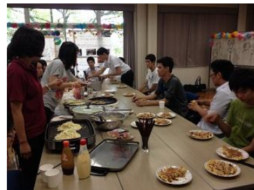
昼食はお好み焼き