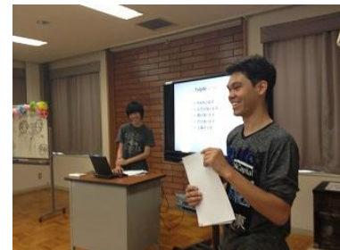
ブラジルクイズ“これは何でしょう？”