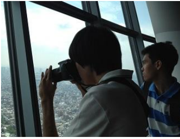
350mから東京都を一望