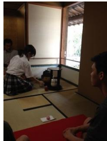
茶道体験“点前が難しそう” “お菓子が美味しかった”